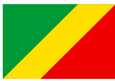
République du Congo